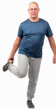
Draai beweging en buiging van de heup