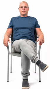
De benen kruisen