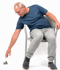
Scheef hangen bij het zitten