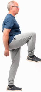
Buiging van de heup (flexie) van meer dan 90°